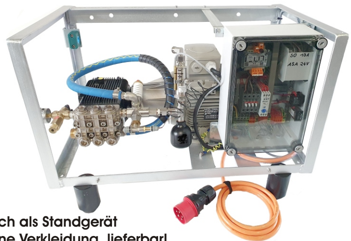
Auch als Standgerät ohne Verkleidung lieferbar!