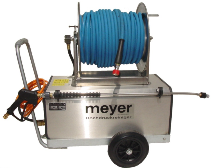
Abbildung mit Sonderausstattung: Schlauchtrommel 16m oder 25m gegen Aufpreis! Auch in V2A lieferbar mit grauen Rädern und HD-Schlauch!

Zubehör: Automatikschlauchtrommel zur Wandmontage in 14,20 und 40m lieferbar!